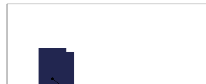
Житловий будинок 1.3 (буд. №4 за ГП) План 1-го поверху