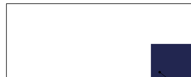
Житловий будинок 1.4 (буд. №3 за ГП) План 1-го поверху